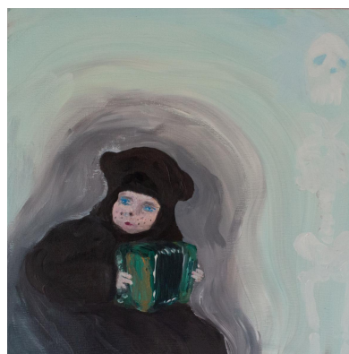
カジュカス祭 リトアニア 2022