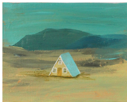
三角形の家 アイスランド 2021