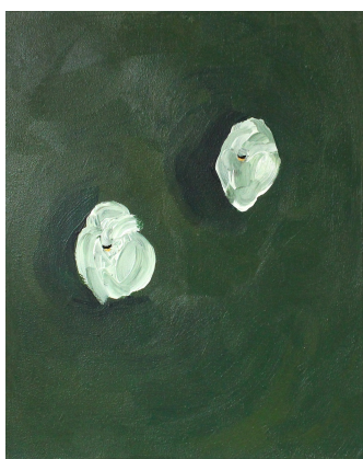
白鳥 チェコ 2021