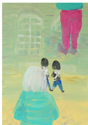
Copenhagen デンマーク 2021